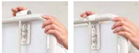
まず、上部パイプに引っ掛けます