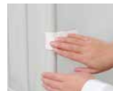
外周パイプに「カチッ」と嵌めます