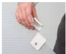
Aパーツのパーツ接合部を、あらかじめ取り付けてあるBパーツにスライドさせます