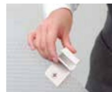
「カチッ」と音がするまでスライドさせます