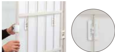
中子パイプに「カチッ」と嵌めます

外と内の両パイプにしっかり嵌めるタイプ 上部パイプ(25~27Φ)に引っ掛けてから、中子パイプ(7~8Φ)に「カチッ」と嵌め、2カ所に確実装着します。結束バンドを通す補助穴もあるので、さらに安心です。3~6mm厚みのブラパール®に対応可能です。