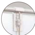
中子パイプに「カチッ」と嵌めます

外周パイプに嵌める小型簡易タイプ 外周パイプ(25~27Φ)に「カチッ」と嵌める簡易装着。外周パイプに装着するので、上部・側面とも固定できます。5~6mm厚みのブラパール®に対応可能です。