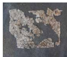
12ヵ月後 ほぼ半分の分解を確認