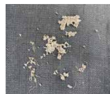
24ヵ月後 破片が2~3mm以下