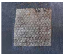
6ヵ月後 分解が目視でも確認