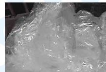
ストレッチフィルム