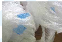
プチプチ® (テープ付き)