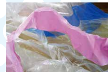
ポリエチレン (テープ付き)