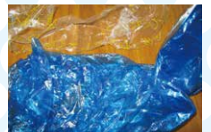
ポリエチレン (有色)

⚠ 本製品は可燃物ですので、火気のそばでの保管・ご使用はおやめください。高温・直射日光下での長期間の保管・ご使用はおさげください。